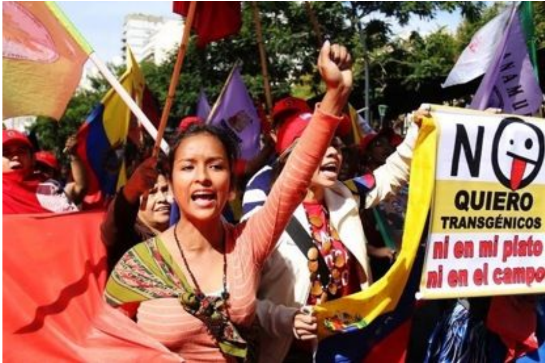
Concentración contra las OMGs en Buenos Aires, Argentina

Del 6 al 17 de octubre de 2014 se celebró en Pyeongchang, Corea del Sur, la Convención de Biodiversidad (CBD)-COP. Nuestro miembro en Corea, La Asociación de Mujeres Campesinas (KWPA, por sus siglas en inglés) ha organizado actividades y acciones para defender la agenda de los pequeños agricultores y ha publicado un informe detallado. Durante las negociaciones formales de CBD, KWPA organizó una marcha contra las OMGs y también protestó en contra del documento desarrollado por La Administración de Desarrollo Rural que alegaba la aparición de un nuevo gusano de seda fluorescente. De la mano de ETC y otros aliados, hemos ejercido presión para regular la biología sintética, demandando una tecnología que combine la ingeniería genética con otras tecnologías industriales para construir alimentos industriales. Después de varios días de negociación con diferentes actores (incluidos los gobiernos que apoyan la biotecnología), 194 países han decidido de forma unánime y durante la conferencia CBD regular la biología sintética. Como resultado, la prohibición implementada para terminar con la geo-ingeniería se mantuvo en la declaración final que reconocía a los pueblos indígenas y a las comunidades locales como actores principales en lo relativo a preservar las fuentes de biodiversidad