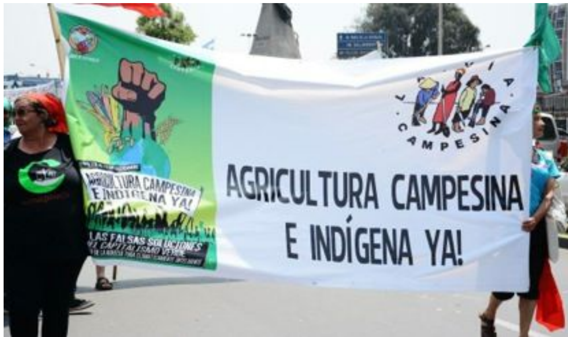
La Vía campesina ha participado en el COP 20 que tuvo lugar en Lima, Perú, en el mes de diciembre 2014.