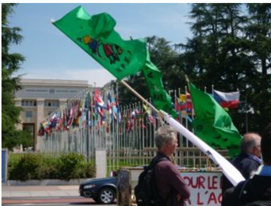
Varios grupos de presión de La Vía Campesina y de sus aliados en Ginebra han dado lugar a un voto mayoritario que apoya la Declaración de los Derechos de los Campesinos del Consejo de Derechos Humanos de las Naciones Unidas.

Sin embargo, entre la penumbra, todavía hay un halo de esperanza. Los campesinos en terreno están luchando contra esto, se mantienen en los terrenos para defender una producción agroecológica basada en los campesinos y sus comunidades. La resistencia contra la producción agroindustrial se encuentra actualmente tanto a nivel nacional como internacional. Además, son varios los Estados que apoyan el proceso de seguir adelante con la Declaración de los Derechos de los Campesinos de las Naciones Unidas, al igual que la nueva iniciativa para crear un reglamento internacional vinculante de las violaciones de los derechos humanos provocada por las actividades de las Empresas Transnacionales, en el Consejo de los Derechos Humanos de las Naciones Unidas. Todo esto nos da esperanzas.