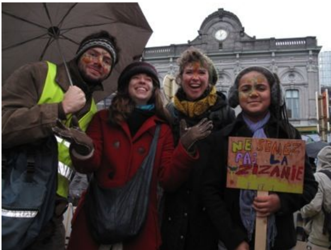
Bruselas, 20 de enero: demostración frente al Parlamento Europeo en fin de obtener el reconocimiento de los derechos de los campesinos para seleccionar, preservar, utilizar, intercambiar y vender sus propias semillas

En 2013, la Comisión Europea ha publicado una propuesta para reformar las 12 directrices sobre semillas incluidas en el reglamento. A pesar de que la propuesta tenga en consideración algunas ideas e incluya algunos aspectos positivos, también permite una mayor liberalización, dando un mayor control a las empresas sobre las semillas. Sin embargo, todavía existe la oportunidad de que los granjeros adquieran el reconocimiento al derecho a intercambiar sus semillas, si se ejerce presión.