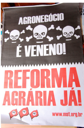
Cartel de la campaña por la reforma agraria en Brasil.

Campesinos y campesinas sin tierra y familias campesinas son activos en la defensa de sus derechos. A pesar de la criminalización a la que están sujetos, muchos movimientos de hombres y mujeres rurales están demandando tierra para cultivos, ocupando la tierra para producir comida para sus familias y sus comunidades y están demandando la legislación de la tierra por parte de sus autoridades. Estos movimientos de resistencia se encuentran en varios países, así como Brasil, Paraguay, Bolivia, Honduras, Nicaragua, Indonesia, Tailandia e India, así como en la mayoría de los países africanos, como vimos en la conferencia.