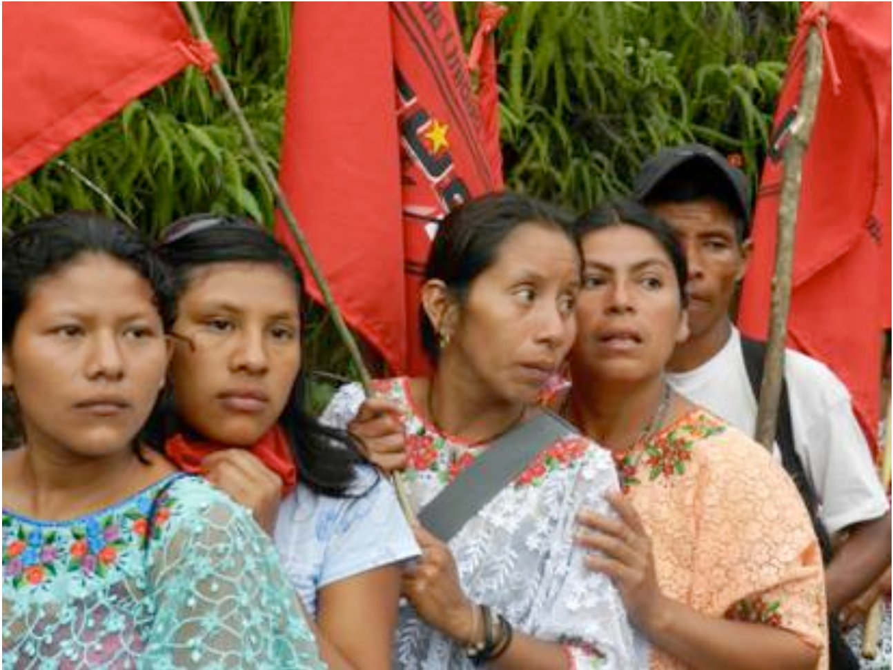
“Marcha hacia la ciudad de Guatemala para reivindicar su derecho a la tierra de campesinos y campesinas desalojados de su tierra” Marzo de 2012.

El gran capital criminaliza los movimientos sociales. En Honduras, 50 campesinos y pequeños productores fueron asesinados en un año (2010-2011). En Guatemala, familias campesinas están siendo desalojadas y están perdiendo sus tierras y sus hogares. Tres personas fueron asesinadas y varias encarceladas.