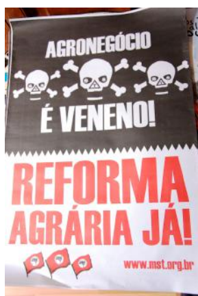
Cartel de la campaña por la reforma agraria en Brasil.

Campesinos y campesinas sin tierra y familias campesinas son activos en la defensa de sus derechos. A pesar de la criminalización a la que están sujetos, muchos movimientos de hombres y mujeres rurales están demandando tierra para cultivos, ocupando la tierra para producir comida para sus familias y sus comunidades y están demandando la legislación de la tierra por parte de sus autoridades. Estos movimientos de resistencia se encuentran en varios países, así como Brasil, Paraguay, Bolivia, Honduras, Nicaragua, Indonesia, Tailandia e India, así como en la mayoría de los países africanos, como vimos en la conferencia.