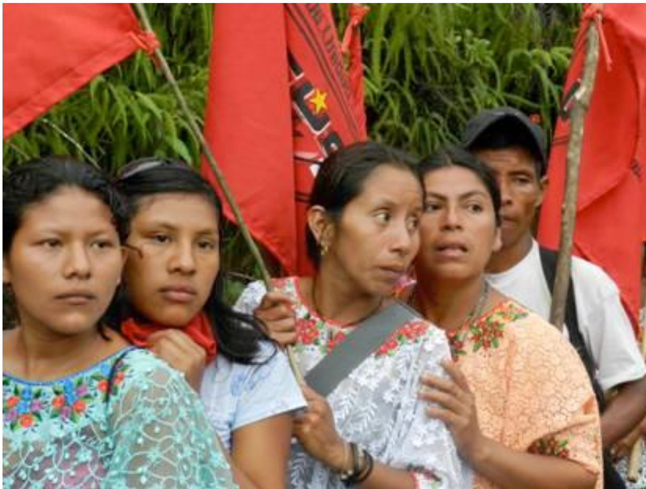
“Marcha hacia la ciudad de Guatemala para reivindicar su derecho a la tierra de campesinos y campesinas desalojados de su tierra” Marzo de 2012. Creditos CLOC/Vía Campesina

El gran capital criminaliza los movimientos sociales. En Honduras, 50 campesinos y pequeños productores fueron asesinados en un año (2010-2011). En Guatemala, familias campesinas están siendo desalojadas y están perdiendo sus tierras y sus hogares. Tres personas fueron asesinadas y varias encarceladas.